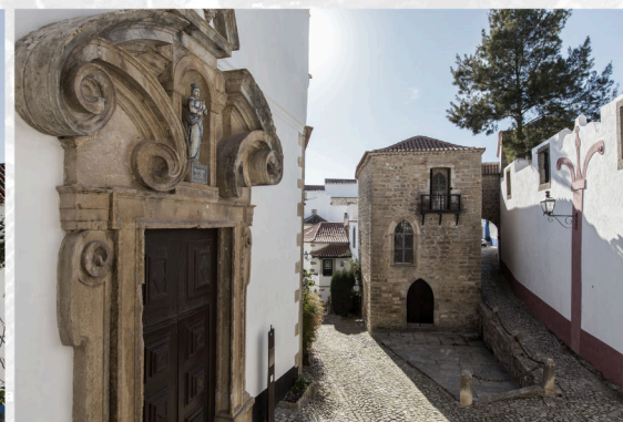
Vista da Torre (a partir da Praça de Santa Maria)