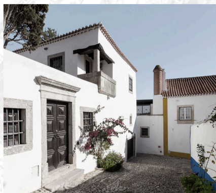
(Trav. Joaquim M. S. Freire) ▶ Porta Entrada