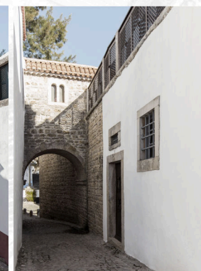
Ponte que liga os edifícios